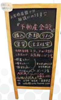
入口には看板でお出迎え