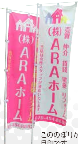
こののぼりが目印です