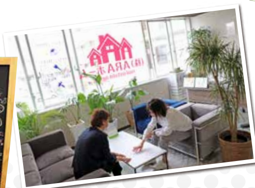
緑に囲まれたソファ席でゆったりと話を伺います

検討してもらえように発信していきたい」と目標を語ります。契約が完了したら終わり！ではなくアフターフォローにも力をいれているので、口コミで相談しやすい不動産屋があるとどんどん広まっていくと嬉しかったです。と今後について語りました。